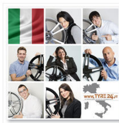
Il team di Tyre24 in Italia